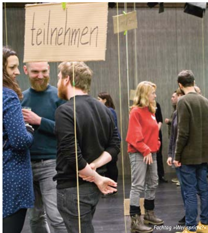
Fachtag »Wer spricht?«

Für schulpraktische Seminare, Fachseminare und Fachbereiche bieten wir zweistündige Workshops an, in denen wir alles selbst ausprobieren und im Hinblick auf Anwendbarkeit für den Unterricht reflektieren. Es sind keine Vorerfahrungen nötig. Voraussetzung für den kostenfreien Workshop ist ein gemeinsamer GRIPS-Theaterbesuch - unabhängig vom Termin des Workshops. Gerne beraten wir jedes Seminar persönlich.