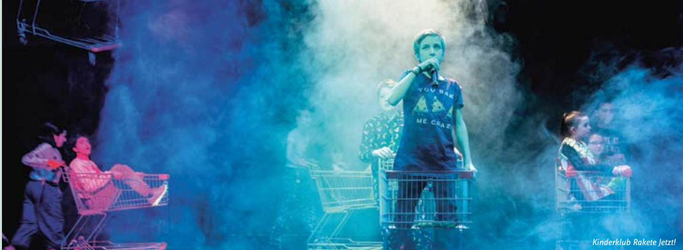
Kinderklub Rakete Jetzt!